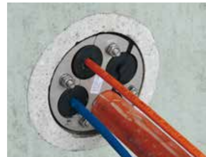
PRESSIO® STEEL UNIVERSAL SPLIT – SPÉCIAL CÂBLES

En version « borgne », les PRESSIO® STEEL SPLIT UNIVERSAL restent parfaitement étanches.