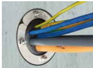
PRESSIO® STEEL UNIVERSAL multicâble (> 4).