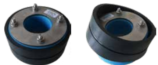
BAGUES DE COMPENSATION