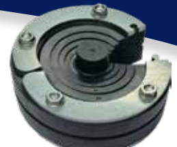
PRESSIO® STEEL UNIVERSAL SPLIT