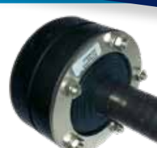
PRESSIO® STEEL UNIVERSAL