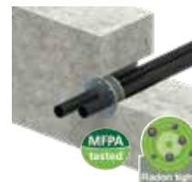
PRESSIO® STEEL REGULAR fabrication sur-mesure.